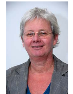
17 - Jet Sebus